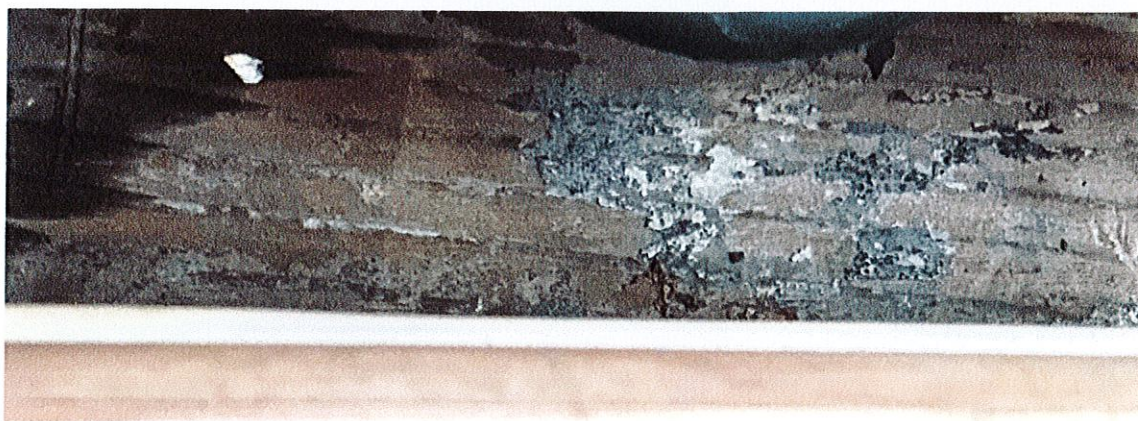
Ślady zabytkowych warstw malarskich na belkach ściany północnej prezbiterium (pod deskami szalunku).

informacji o tym, czy pod deskami szalunku wewnętrznego zachowały się wcześniejsze warstwy malarskie. Nad wejściem do zakrystii, pod płytą z dekoracją malarską widoczna jest pierwotna powierzchnia belek konstrukcyjnych ściany północnej. Widać na nich ślady warstw malarskich o błękitnej kolorystyce.