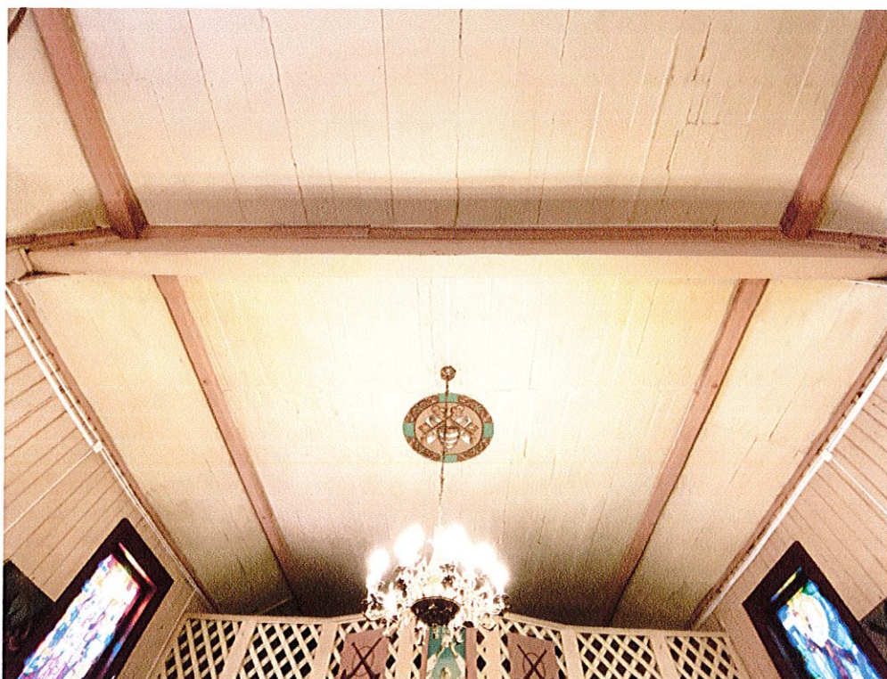
Fot. 5, 6. Drewniany kościół z 1662 r. pw. Św. Teresy od Dzieciatka Jezus w Stodółach (powiat opatowski). Stan przed wykonaniem badań stratygraficznych. Widok wnętrza kruchty i dekoracji z emblematem papieskim na stropie. Wyk. M. Gruszczyński, luty 2021 r.