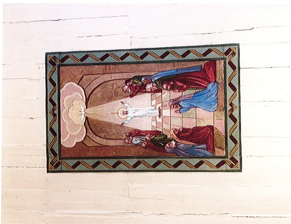
Fot. 3, 4. Drewniany kościół z 1662 r. pw. Św. Teresy od Dzieciątka Jezus w Stodółach (powiat opatowski). Stan przed wykonaniem badań stratygraficznych. Widok wnętrza nawy i dekoracji z przedstawieniem Zesłania Ducha Świętego na stropie. Wyk. M. Gruszczyński, luty 2021 r.