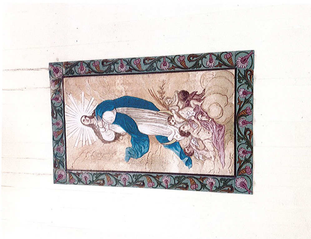
Fot. 1,2. Drewniany kościół z 1662 r. pw. Św. Teresy od Dzieciątka Jezus w Stodółach (powiat opatowski). Stan przed wykonaniem badań stratygraficznych. Widok wnętrza prezbiterium i dekoracji z przedstawieniem Matki Boskiej Niepokalanej na stropie. Wyk. M. Gruszczyński, luty 2021 r.